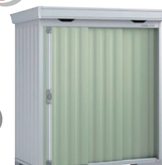
イナバ物置FS 1809S 物件に設置いたします ※ご成約時に色をお選びいただけます