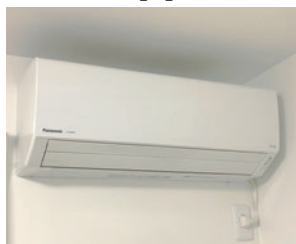
Panasonic Jシリーズ 物件に設置いたします